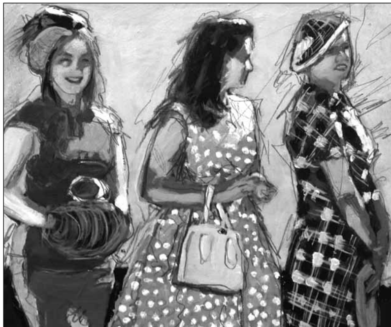
Frauen sind wie Männer – nur anders / Mixed Media on Canvas | 80x80, Helga Zumstein